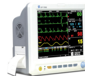
Monitor ζωτικών παραμέτρων