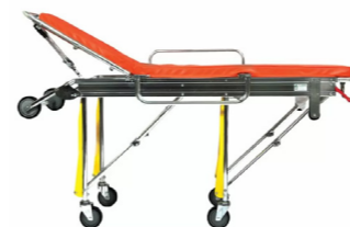
Φορείο ασθενούς σπαστό