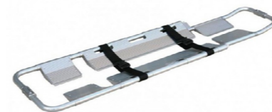
Φορείο Scoop Αλουμινίου