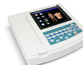
Ηλεκτροκαρδιογράφος 12 Καναλος