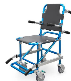
Καρέκλα με 4 ρόδες