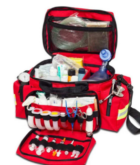
Βαλίτσα πρώτων βοηθειών