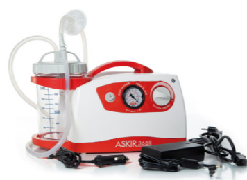
Αναρρόφηση ρεύματος μπαταρίας ASKIR 36BR