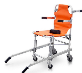
Κάθισμα μεταφοράς Gima