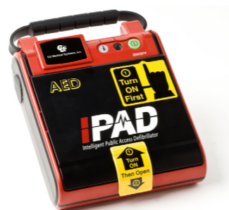
Αυτόματος απινιδωτής CU