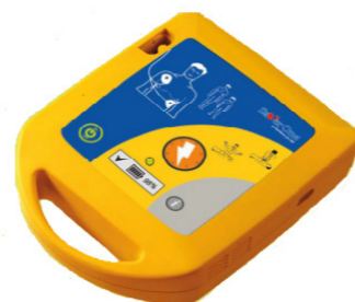
Αυτόματος εξωτερικός απινιδωτής