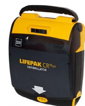
Απινιδωτής LIFEPAK CR Plus